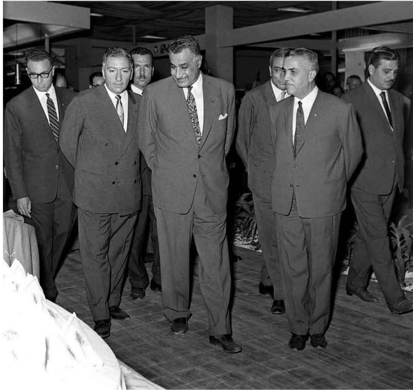
إفتتاح المعرض الصناعي ١٩٦٤/٧/٣